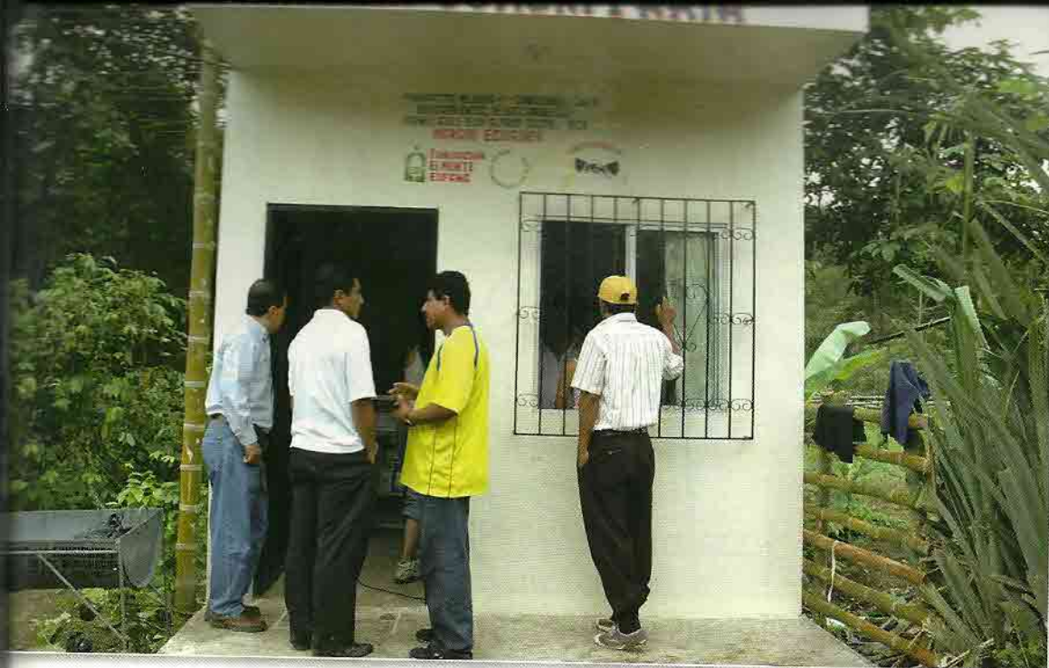
A la izquierda, miembros de la Comisión Permanente creada por el COFM ante la catástrofe de Haití. Arriba, una farmacia comunitaria en el país caribeño.